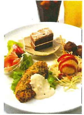
☆パーティープランA (1人盛)