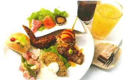
☆パーティープランC (1人盛)