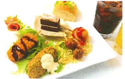
☆パーティープランB (1人盛)